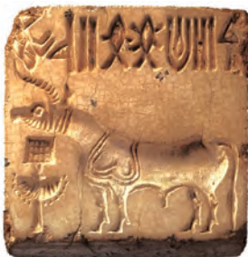
एक हड़प्पाई मुहर

भारत के अतीत की सबसे पहली तसवीर उस सिंधु घाटी सभ्यता में मिलती है, जिसके अवशेष सिंध में मोहनजोदड़ो और पश्चिमी पंजाब में हड़प्पा में मिले हैं। इन खुदाइयों ने प्राचीन इतिहास की समझ में क्रांति ला दी है।