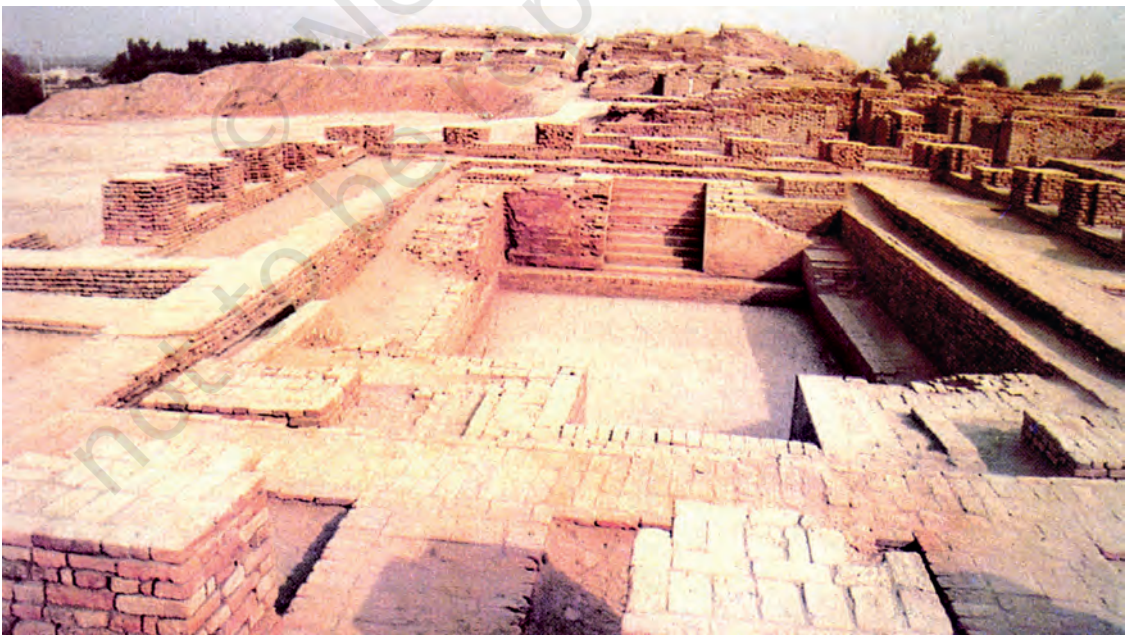
मोहनजोदड़ो का महान स्नानागार

सिंधु घाटी सभ्यता और वर्तमान भारत के बीच समय के ऐसे कई दौर गुज़रे हैं जिनके बारे में हम बहुत कम जानते हैं। वैसे भी इस बीच असंख्य परिवर्तन हुए हैं। लेकिन भीतर ही भीतर निरंतरता की ऐसी श्रृंखला चली आ रही है जो आधुनिक भारत को छः-सात हजार पुराने उस बीते हुए युग से जोड़ती है जब संभवतः सिंधु घाटी सभ्यता की शुरुआत हुई थी। यह देखकर अचरज होता है कि मोहनजोदड़ो और हड़प्पा में कितना कुछ ऐसा है जो हमें