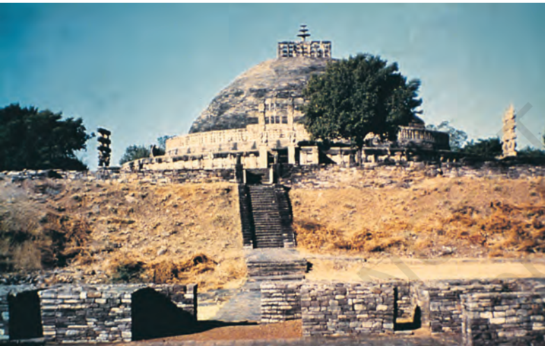
अशोक के समय में निर्मित साँची का स्तूप

इस अद्भुत शासक ने, जिसे आज भी भारत और एशिया के बहुत से दूसरे भागों में प्यार से याद किया जाता है, अपने आपको बुद्ध की शिक्षा के प्रचार में, नेकी और सद्भाव के काम में तथा प्रजा के हित के लिए सार्वजनिक कार्यों के प्रति समर्पित कर दिया। उसने ऐलान कर दिया था कि वह इनके लिए हमेशा तैयार है। हर स्थान पर और हर समय, सरकारी कर्मचारी जनता के कार्यों के बारे में उसे बराबर सूचना देते रहें, चाहे जिस समय और जहाँ भी हो वह लोक-हित के लिए अवश्य काम करेगा।