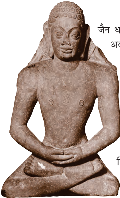
मथुरा से प्राप्त महावीर की लगभग तीसरी शताब्दी ईसवी की एक मूर्ति

जैन धर्म और बौद्ध धर्म दोनों वैदिक धर्म से कटकर अलग हुए थे और उसकी शाखाएँ थे। पर उन्होंने वेदों को प्रमाण नहीं माना। तमाम और बातों में सबसे बुनियादी बात यह है कि आदि कारण के बारे में वे या तो मौन हैं या उसके अस्तित्व से इंकार करते हैं। दोनों अहिंसा पर बल देते हैं और ब्रह्मचारी भिक्षुओं और पुरोहितों के संघ बनाते हैं। उनके नज़रिए एक हद तक यथार्थवादी और बुद्धिवादी हैं। जैन-धर्म का एक बुनियादी सिद्धांत यह है कि सत्य हमारे दृष्टिकोण की सापेक्षता में होता है। इसमें जीवन और विचार में तपस्या के पहलू पर बल दिया गया है।